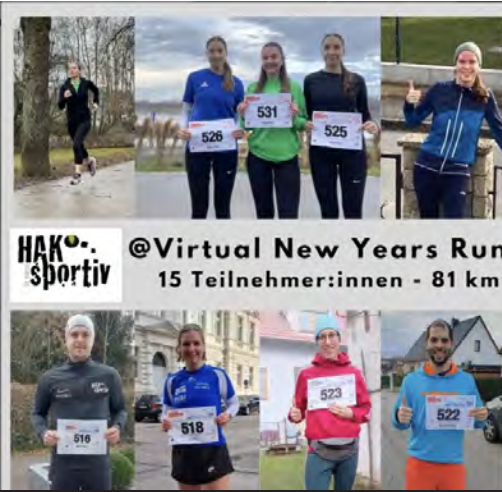
@Virtual New Years Run 15 Teilnehmer:innen - 81 km

Entrepreneure setzen sich für ihre Umwelt ein! Das sind die Projekte aus 2022/23: